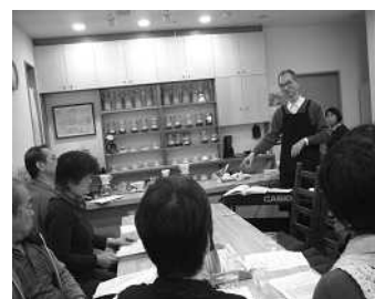
第1回寺子屋サロン (2010年3月20日) 『目からウロコの音楽 修業』