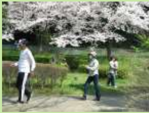
4月に開催した「祭りずし作り」と「ウォーキング教室」の講座の様子