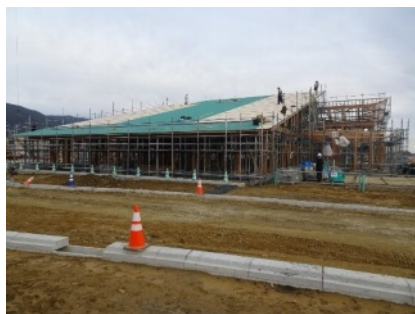
建設中の新図書館です(平成28.12.26撮影)

いつも本のご寄付をありがとうございます。 陸前高田市の図書館は現在建設中(下の写真)、6月ごろにはオープンのようなので、引き続き本のご寄付を募っていますので応援をよろしくおねがいします。