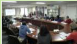
空き家問題を考える学習会(右) トトロの森散策ツアー(左)

講師派遣について 身近な地域に講師をお呼びすることも可能です。2017年度は、「お片づけ」「おせち」「ワイン」「防災備蓄」「操体法」「スパイス」などをテーマに講師派遣の依頼をいただきました。