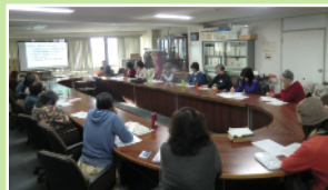
空き家問題を考える学習会(右) トロの森散策ツアー(左)

講師派遣について 身近な地域に講師をお呼びすることも可能です。2017年度は、「お片づけ」「おせち」「ワイン」「防災備蓄」「操体法」「スパイス」などをテーマに講師派遣の依頼をいただきました。