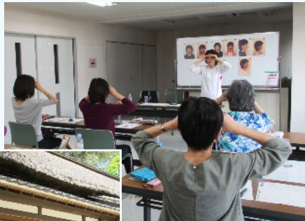
見沼田んぼを歩くツアー