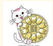
行政書士会連合会マスコットキャラクター ユキマさん

埼玉県行政書士会朝霞支部、コスモス成年後見サポートセンターに所属。あなたの街の身近な法律家・気軽に相談できる行政書士として、地域密着で活動しており、公民館等での無料相談会、高齢者施設や認知症カフェの支援活動も行っています。